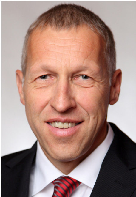
«Bundesrat kann jeder werden, Ständerat nicht.»

Ganz einfach: wieder in den Ständerat! Für mich ist der Ständerat das höchste der Gefühle. Ich zitiere da gerne Alt-Bundesrat Alphons Egli. Wie schrieb er mir doch im Gratulationsschreiben vor vier Jahren: «Das Ständeratsmandat ist das schönste